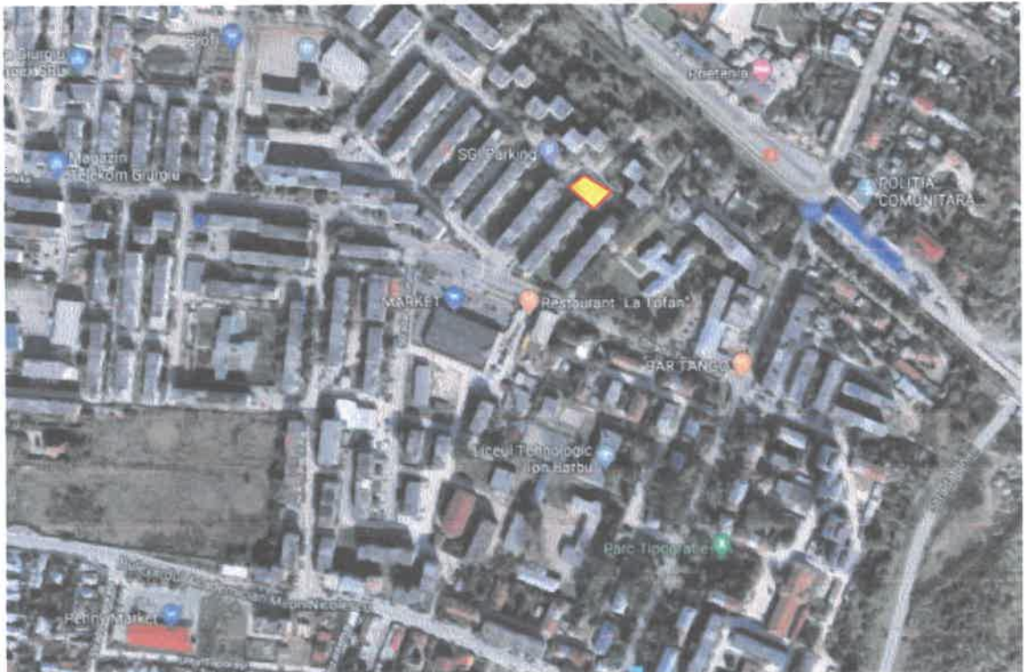
Terenul si Punctul Termic 53 situate langa blocul E2 din cartierul Tineretului.